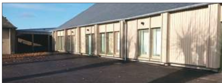
..... Vue générale de la cour refaite entièrement pour supprimer toutes les marches d'entrée et la mise en accessibilité.