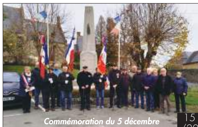
Commémoration du 5 décembre