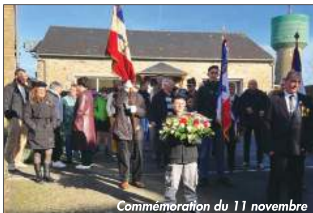
Commémoration du 11 novembre