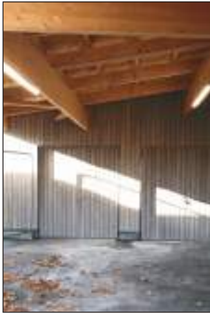
Création d'un préau .....